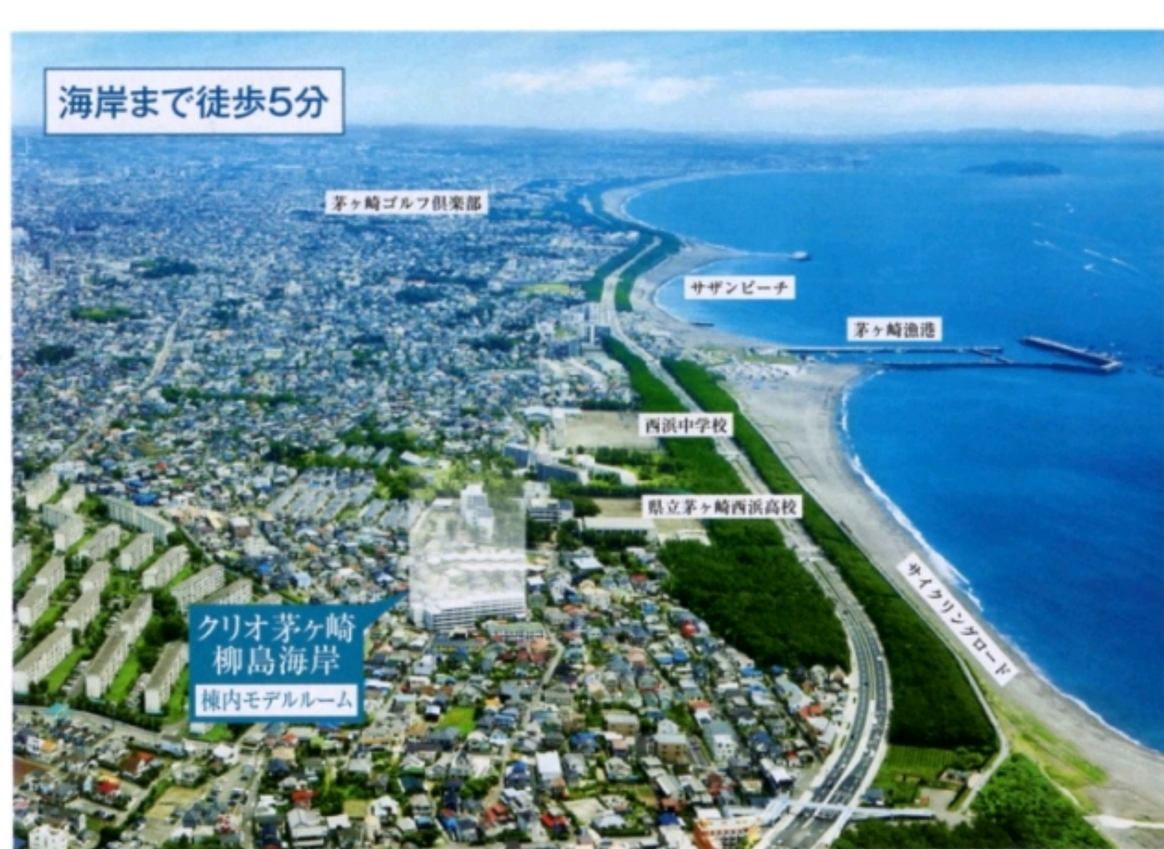
掲載の現地周辺航空写真は、平成21年6月に撮影したものです。